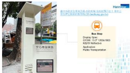
Bus Stop Display Spec: Q1300: 15.3" 1200x1800 RGBW Reflective Application: Public Transportation