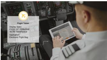
Flight Tablet Display Spec: P1022: 10" 1536x2048 16.7M Transflective Application: Electronic Flight Bag