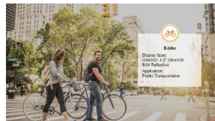
E-bike Display Spec: Q94010: 4.3" 300x600 RGBW Reflective Application: Public Transportation

お問い合わせ: 兼松フューチャーテックソリューションズ株式会社 東京担当: 第一営業本部 第一営業部 第一課 佐藤 幸裕 電話: 03-5542-5931 大阪担当: 第一営業本部 第一営業部 第二課 山門 徹 電話: 06-6251-7700 Web site: https://www.kft.kanematsu.co.jp/